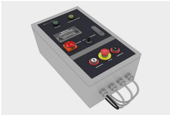
Корпус блока управления из нержавеющей стали AISI304