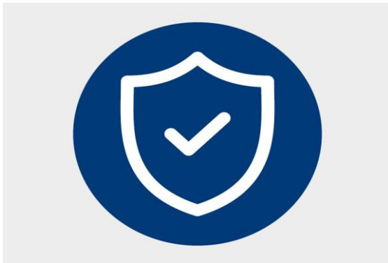
Подогрев привода и стоек