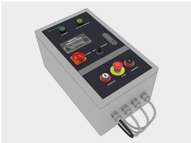
Корпус блока управления из нержавеющей стали AISI304